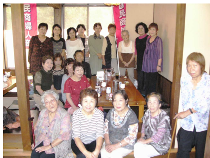
ました。婦人部員14人と、商工新聞読者4人に事務局1人と、会場の新