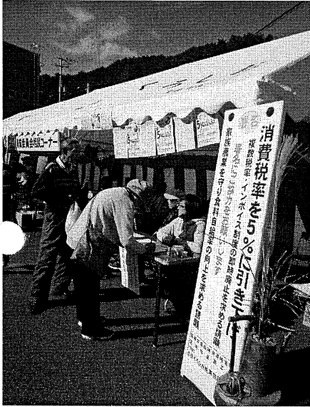
署名中の皆さんと呼び掛け看板