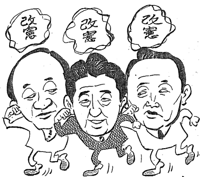
お友達と右へ右へ!