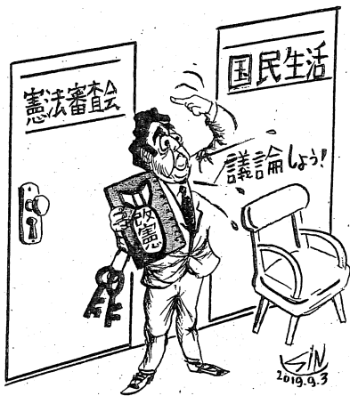
国民の願いは右の扉を開けること —国会閉会中審議—