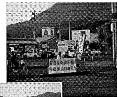
19日行動 スタンディング