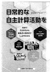
《 緑色 》

今回は、「夜はよう出ん」という声にお応えして 各会場で昼の部を設けています。お近くの会場 へぜひご参加ください。