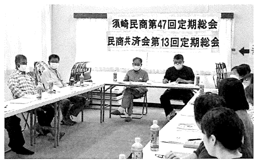
須崎民商第47回定期総会 民商共済会第13回定期総会

須崎民商は7月27日(土)須崎市多ノ郷公民館にて須崎民商第47回定期総会・同共済会13回定期総会を開催し、15人が参加しました。2023年度の活動報告方針(案)、決算報告書・2024年度予算案、役員決定がされました。