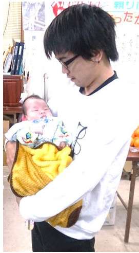
(4/10 香美郡民商共済会報)

「男性会員(共済加入者)にも出生祝金を！」という役員さんの意見からきた香美郡民商共済会独自の給付制度です。子の誕生時に1万円の祝い金が出ます。是非加入を！」