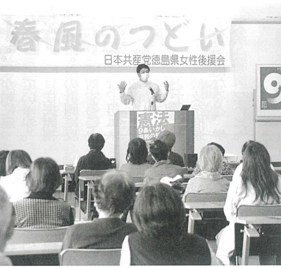
徳島県女性後援会の「春風のつどい」