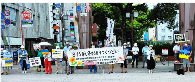
8月15日、高知市中央公園北口で開かれ、約50人が参加。平和への思いを訴えました。