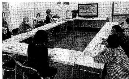
地域ごとに連続して開催された須崎民商のインボイス学習会(須崎会場)