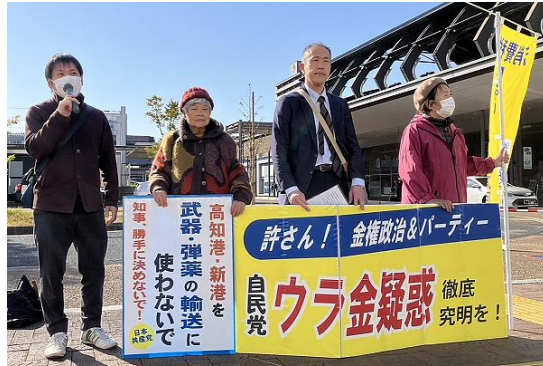
高知市実行委員会団体の宣伝行動(高知駅前)

(安芸は12日、中村は14日に開催)。 自主申告、インボイス制度廃止、大軍拡・大増税反対などがかかげ開催。合わせて、「自民党ウラガネ議員に課税せよ」とアピールしました。 全国では、500ヶ所で開催されました。