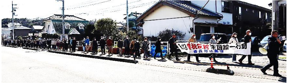
南国集会(デモ行進)

3月13日(水)、重税反対全国統一行動が取り組まれ、高知県内では6ヶ所562人が参加しました。